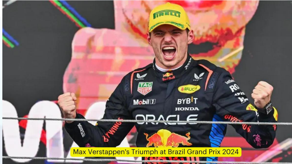
Max Verstappen's Triumph at Brazil Grand Prix 2024

బ్రెజిల్ గ్రాండ్ ప్రీక్స్ 2024లో మాక్స్ వెర్స్టాపెన్ విజయం