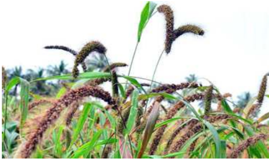
Harvest time: Foxtail millets ready to be harvested at a farm at Thoopanaickenpatti in Dindigul district. G. KARTHIKEYAN

The study was conducted by the Madras Diabetes