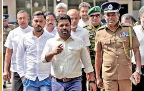
Confident stride: President Anura Kumara Dissanayake walking out after casting his vote in the election on Thursday.