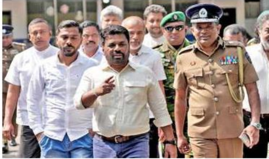
Confident stride: President Anura Kumara Dissanayake walking out after casting his vote in the election on Thursday.

The National People's Power (NPP) won a total of 159 seats in the 225-member House, securing over two-thirds majority, official results declared on Friday showed. The Opposition Samagi Jana Balawegaya (SJB or United People's Force) followed, with just 40 seats. The formerly powerful Rajapaksas' party, Sri Lanka Podujana Pera-