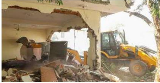
Wheels of injustice: Workers razing the property of an accused in an RSS attack case in Jaipur in October, citing violations.

They include 15 days' prior notice of demolition to the occupants with details of the nature of the unauthorised construction