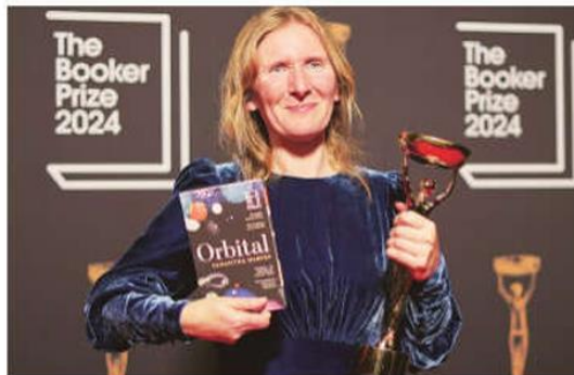
British author Samantha Harvey after winning the Booker Prize 2024, in London.

She dedicated the prize to everyone who speaks "for and not against the Earth, for and not