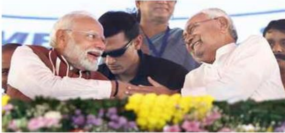
Prime Minister Narendra Modi with Bihar Chief Minister Nitish Kumar at an event in Darbhanga on Wednesday.

Addressing a gathering at the event in Darbhanga, Mr. Modi highlighted the development work undertaken by the National Democratic Alliance (NDA) go-