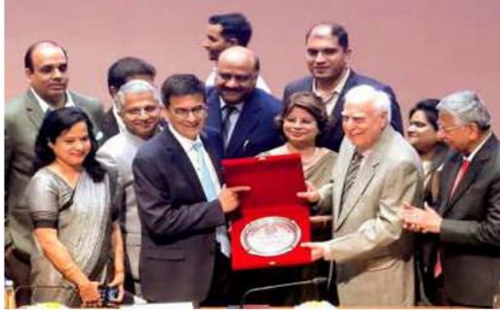
CJI Chandrachud being presented a memento by senior advocate Kapil Sibal and others during the farewell function on Friday.

Later, at a speech at a farewell function organised by the Supreme Court Bar