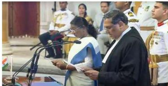
President Droupadi Murmu administering the oath of office to Justice Sanjiv Khanna at the Rashtrapati Bhavan on Monday.

iciary's commitment and responsibility as “protectors of citizens' rights and dispute resolvers”.