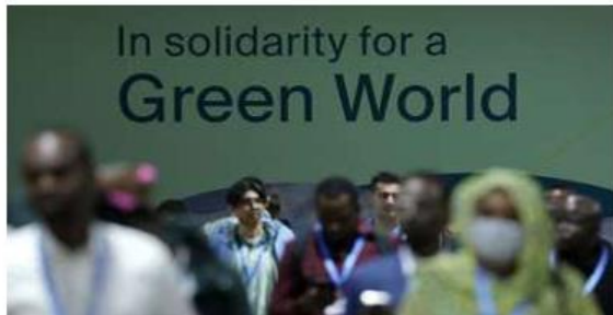
Global goal: Participants walk past a banner on the opening day of COP-29, in Baku on Monday.

The re-election of Donald Trump as U.S. President has already cast a shadow over the meet where the main focus is on agreeing on climate financing – who pays, how much is needed, and how the funds would be used to address climate adaptation, mitigation and loss/damage.