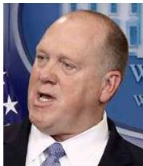
Tom Homan and Elise Stefanik.

“I am pleased to announce that the Former ICE Director, and stalwart on Border Control, Tom Homan, will be joining the