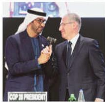
COP28 president Sultan al-Jaber (left) hands over the gavel to COP29 president Mukhtar Babayev in Baku.